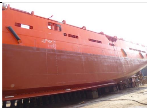
Foto 7 - Costado bombordo