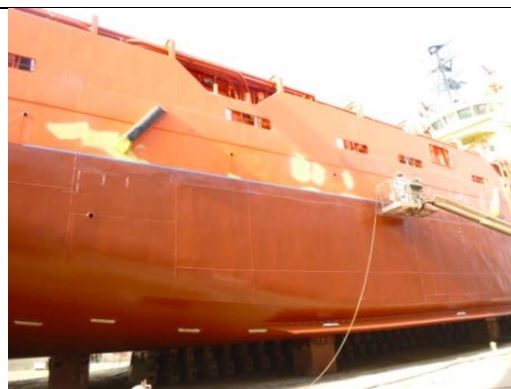
Foto 6 - Costado boreste