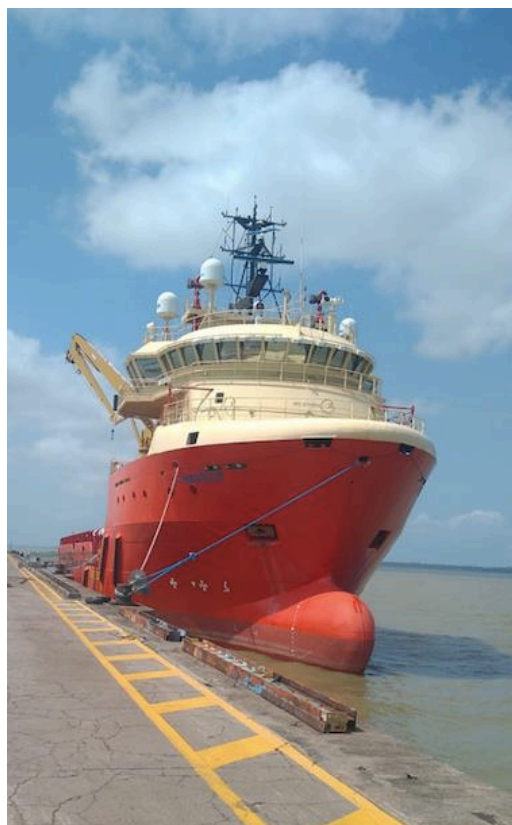
Figura 1 – Embarcação C-Warrior