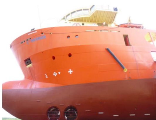
Foto 3 - Proa bombordo