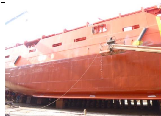
Foto 5 - Costado boreste