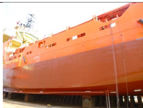
Foto 8 - Costado bombordo