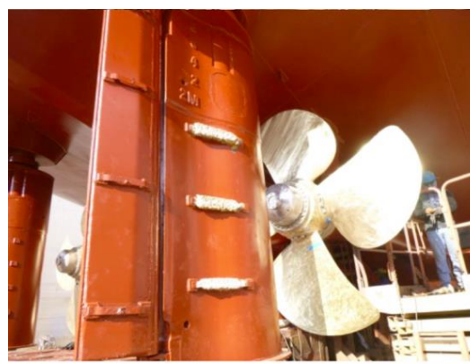
Foto 10 - Balanço de popa, leme e hélice por boreste