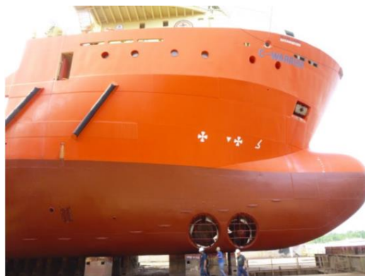
Foto 2 - Proa boreste